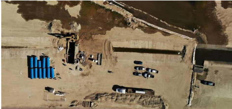
Figura 4 MEJORAS A LA PLANTA DE BOMBEO PBCILA