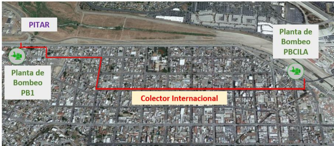
Figura 2 NUEVO COLECTOR INTERNACIONAL