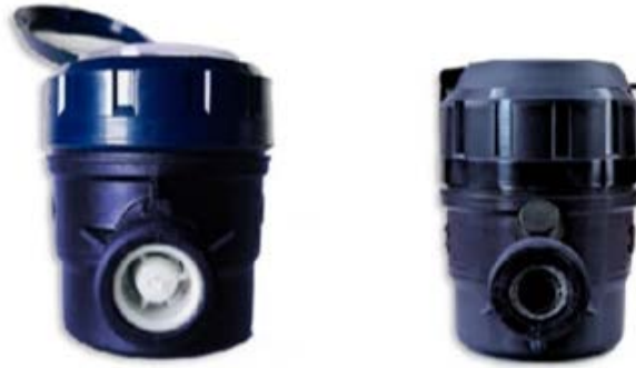
Figura 4 MEDIDOR DE VELOCIDAD DE CHORROS MÚLTIPLES

Los medidores de velocidad tienen una tapa para mantenimiento, lo que permite un fácil acceso para reemplazar cualquier pieza. La lectura remota proporciona mediciones en tiempo real e información sobre el consumo del agua sin la necesidad de visitar el hogar o el sitio. El módulo de lectura automatizada del medidor recibe una transmisión magnética del volumen de agua entregada a cada vivienda. La información se transmite vía radiofrecuencia al sistema de registro y datos. El personal de OOMAPAS será capacitado en el uso del equipo, una vez que el nuevo sistema comercial esté disponible y conforme a los especificado en los contratos de compra o de instalación.