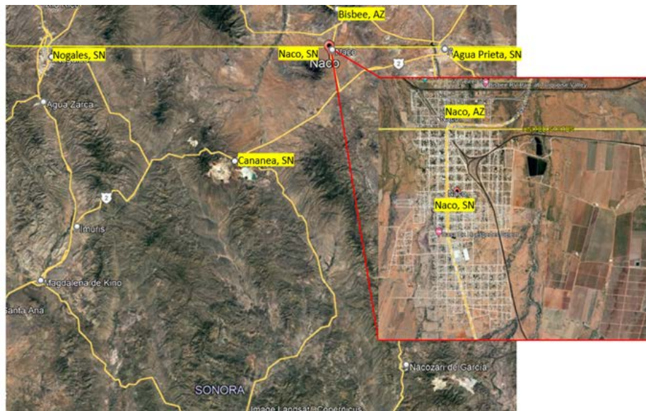
Figura 1 MAPA DE UBICACIÓN DEL PROYECTO