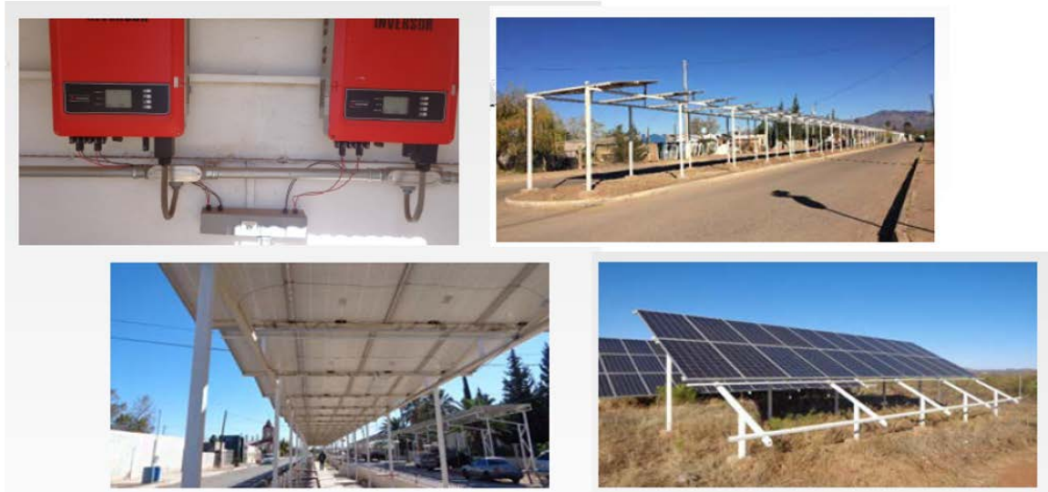
Figura 3 SISTEMA DE PANELES SOLARES

Aunque los paneles solares y los componentes relacionados se instalaron en 2018, el sistema no funciona y se requieren inversiones adicionales para conectarlo a la red eléctrica. Además, el OOMAPAS retiró y almacenó algunos de los paneles para protegerlos de actos de vandalismo u otras amenazas. Se presenta más información sobre la condición actual de los paneles solares y los inversores en la siguiente sección.