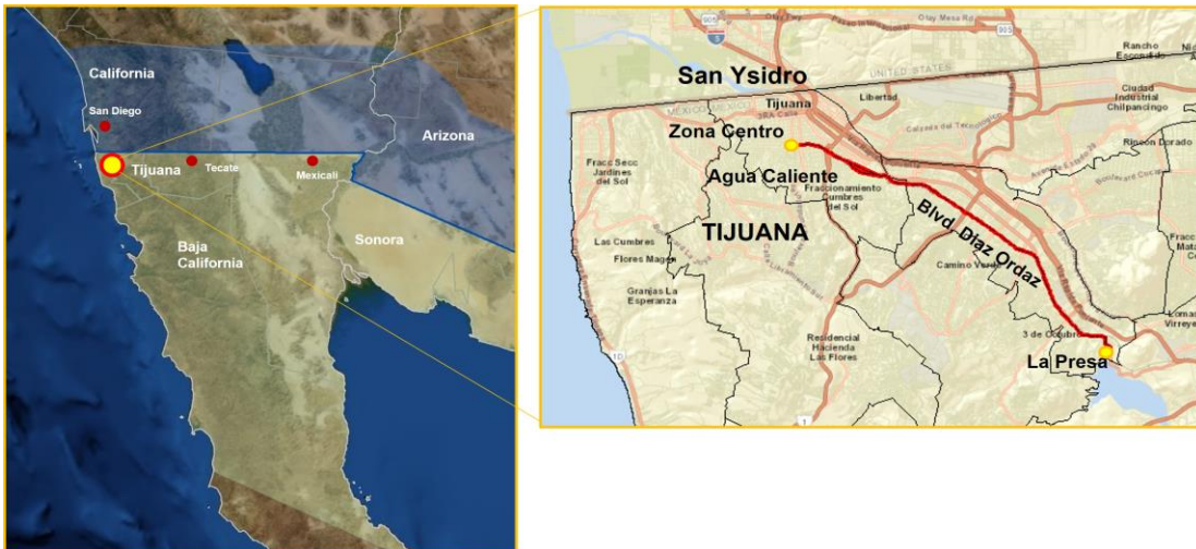
Figura 1 MAPA DE UBICACIÓN DEL PROYECTO

La ciudad de Tijuana se encuentra en la región norponiente del estado de Baja California, adyacente a la frontera entre México y Estados Unidos y aproximadamente a 26 kilómetros al sur de la ciudad de San Diego, California. El corredor Agua Caliente corre paralelo al río Tijuana por aproximadamente 17 kilómetros, desde el centro de Tijuana, cerca de la frontera entre México y Estados Unidos, hasta “La Presa” (Abelardo L. Rodríguez) ubicada al sureste de la ciudad. Sus coordenadas aproximadas son: 32°30'4.50" latitud norte y 116° 58'13.96" longitud oeste. La Figura 1 muestra la ubicación del Proyecto.